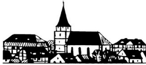
Heimat- und Gartenbauverein Weißenbrunn vorm Wald e.V.

Heimat- und Gartenbauverein Weißenbrunn vorm Wald e.V. Bergheimstraße 36 96472 Rödental hgv.weissenbrunn@gmail.com