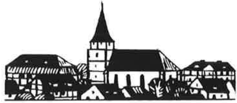
Heimat- und Gartenbauverein Weißenbrunn vorm Wald e.V.

Heimat- und Gartenbauverein Weißenbrunn vorm Wald e.V. Bergheimstraße 36 96472 Rödental hgv.weissenbrunn@gmail.com